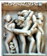
En los templos. India.