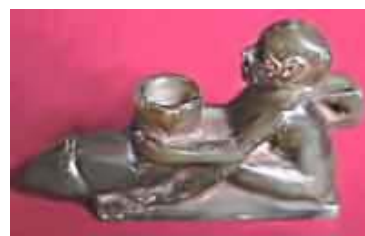
Egipto. Ofrendas al dios RA.