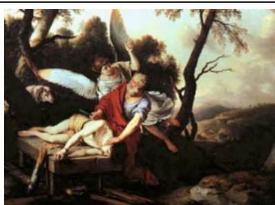
La circuncisión de Abraham