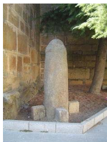
Campamento romano. Rabanales. Roma.

“Esto sucederá debido a la multitud de las fornicaciones de la prostituta, de bella apariencia y experta en hechizos, que seduce a las naciones con sus fornicaciones y a los pueblos con sus hechizos.” Nahum 3:4