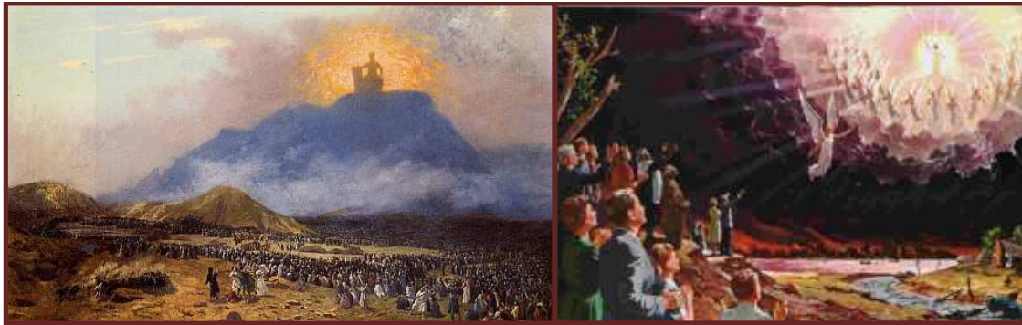
Contexto de Hebreos 12:18-21